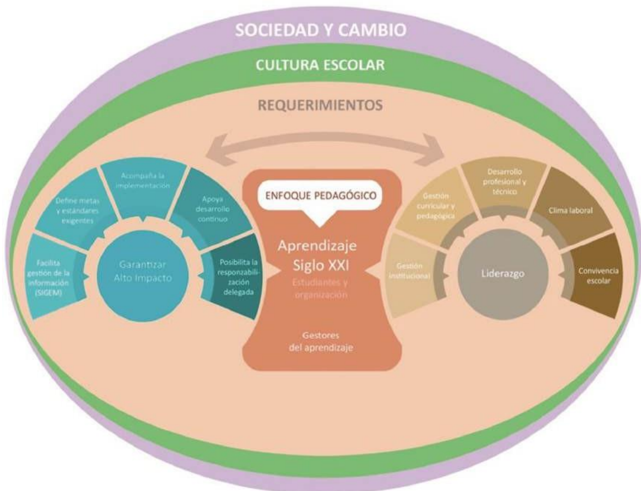
Marco complementario para la instalación del cambio

El esquema que sigue muestra los distintos niveles de la gestión que inciden de manera directa o indirecta en el aprendizaje de los miembros de la institución, particularmente, los estudiantes, en consideración de una cultura escolar que se inserta en una sociedad de cambio.