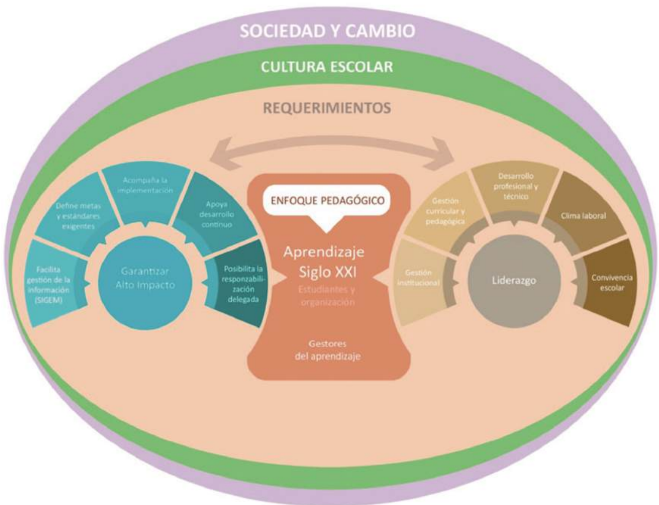
Marco complementario para la instalación del cambio

El esquema que sigue muestra los distintos niveles de la gestión que inciden de manera directa o indirecta en el aprendizaje de los miembros de la institución, particularmente, los estudiantes, en consideración de una cultura escolar que se inserta en una sociedad de cambio.